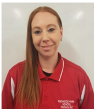
AST. DIRECTOR: STACY